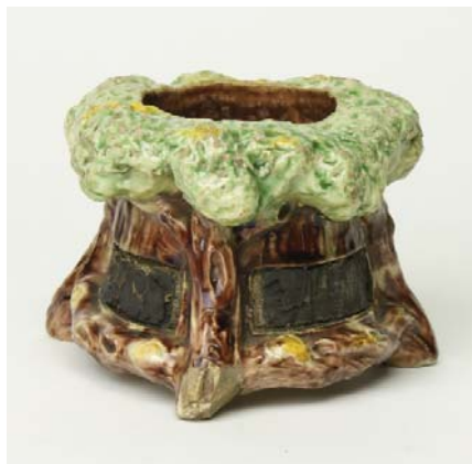
Links: pyrogène (luciferstandaard), Grolleman & Nierdt Rechts: bloempot met hondekop, Grolleman & Nierdt