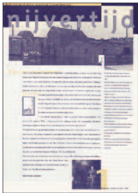
1 Stoomolieslagerij Gebroeders Ten Hove