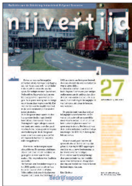
27 Sporen naar bedrijven