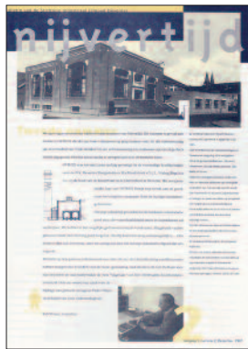
2 Drukkerij Ovimex 75 jaar