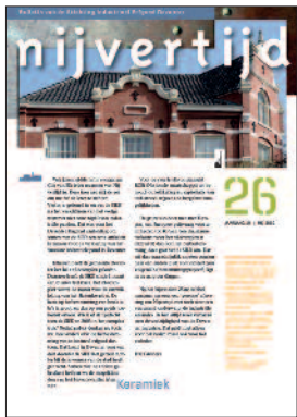
26 150 Jaar keramiek in Deventer