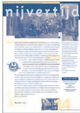
14 "Fabricatie van vleeschwaren"