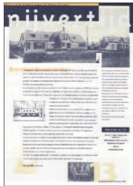
13 Van karnende boerin tot zuivelreus