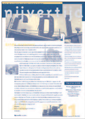
11 De silo's van Wijers