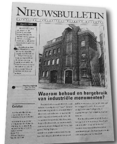
Het nieuwsbulletin van april 1996

Na ruim een kwart eeuw Nijvertijd gaat SIED op een andere manier verder met een weergave van informatie over de voormalige Deventer industrie. Zo'n twintig jaar geleden kwam naast het archiefonderzoek en fotografie, ook interview als wijze van onderzoek naar voren. Muren zeggen geen woord, oud-medewerkers hebben daarentegen vaak veel te vertellen en kunnen ook het gevoel dat erbij hoort overbrengen. Van het begin af aan heb ik me met veel genoeg beziggehouden met interviews. In deze laatste Nijvertijd wil ik daarom graag een 'droste-effect' in woorden maken, een kwart eeuw geschiedenis over de Deventer industrie-geschiedenis. Ik laat de gezamenlijke redactie aan het woord, naast degene die zich verantwoordelijk maakte en onmisbaar was voor de verspreiding van ons mooie bulletin.