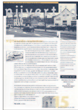
15 Raambuurt, herrezen en ...behouden