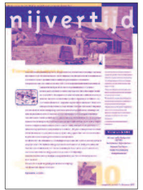
10 De steenfabrieken langs de IJssel