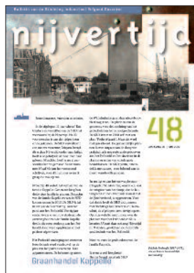
48 Graanhandel Kapelle