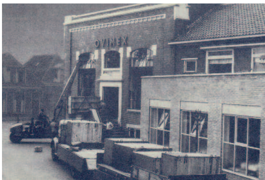
Ovimes vestiging in de Hallenstraat

De indruk die ik als interviewer overhoud aan het gesprek met deze bevlogen redactieleden, is dat zij met grote toewijding in kameradschap tot mooie producten kwamen. Maar welk nummer vinden zij het meest bijzondere?