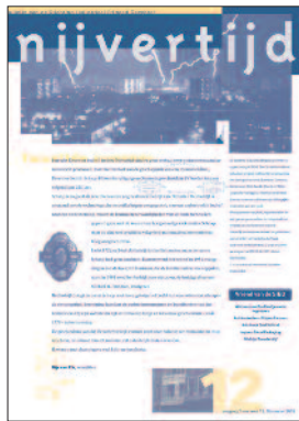
12 Schaaap Bliksembeveiliging