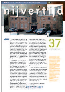
37 Ten Zijthoff