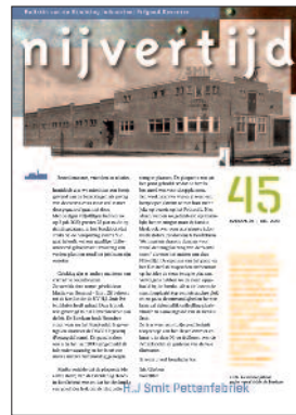
45 NV H.J. Smit Pettenfabriek