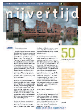
50 Afscheid van Nijvertijd