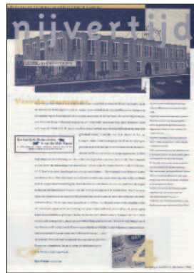
4 Deventer en zijn sigarenmakers