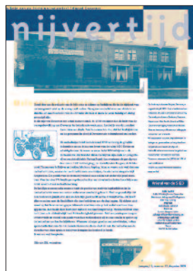
23 Passie voor metaal