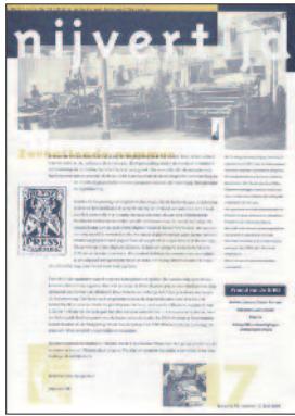
17 Deventer, een industriële drukkerstad