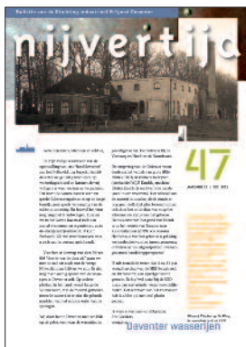
47 Deventer wasserijen