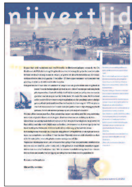
9 Industriële geschiedenis Pothoofd