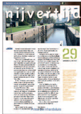
29 Haven toegankelijker door nieuwe sluis