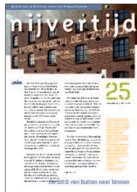
25 Top 10 industriële panden