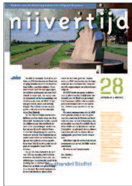
28 Houtzagen aan de IJssel