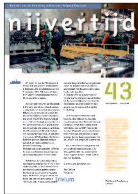
43 Thomassen & Drijver