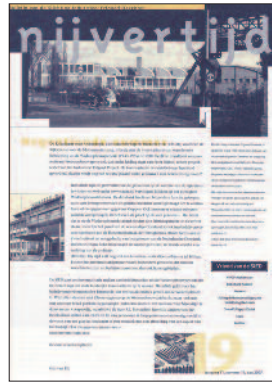
19 Industriële wederopbouwarchitectuur