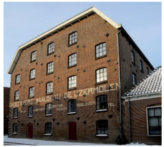
Uit Nijvertijd nr. 25. Modellenmagazijn Nering Bögel, Raamstraat

de redactie maar hij was er gewoon altijd. Hij zocht, maakte foto's en reproducties. Als een foto niet precies paste in de beschikbare ruimte van de bladspiegel, dan ging Theo erop af om weer een andere foto te maken die wél zou passen in het format.