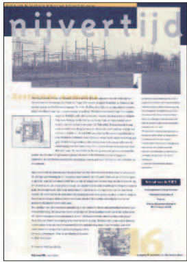
16 Hoe Deventer elektriciteit kreeg