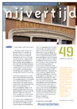
49 Muurreclames in Deventer