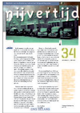
34 Ons belang