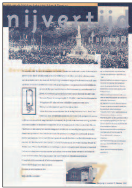
7 Deventer drinkwater