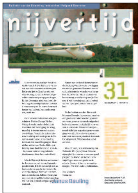
31 Janus Bauling