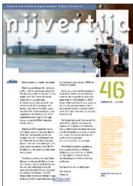
46 Farmacie aan de IJssel