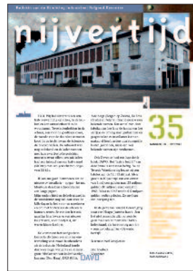
35 DAVO haardenfabriek