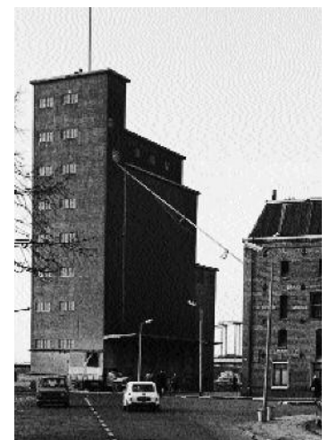
Uit Nijvertijd nr.92. Silo Kapelle, Pothoofd