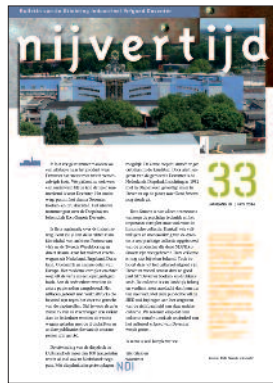
33 Diepdruk in Deventer