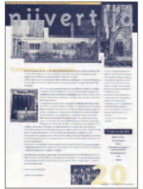
20 Industrie inspireert!