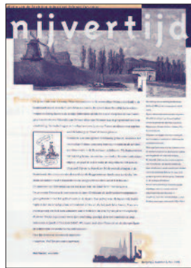
3 De Oude Schil