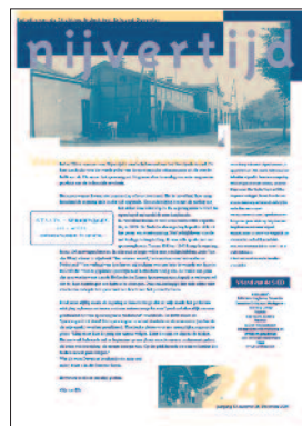
24 Het spoor naar Deventer