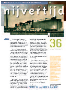
36 Noury & van der Lande