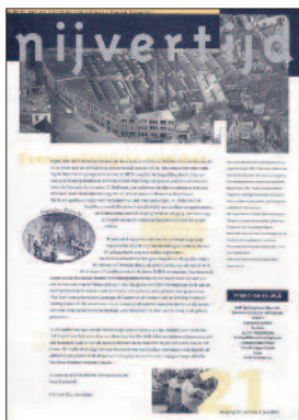
21 DAIM: tubes, capsules en meer