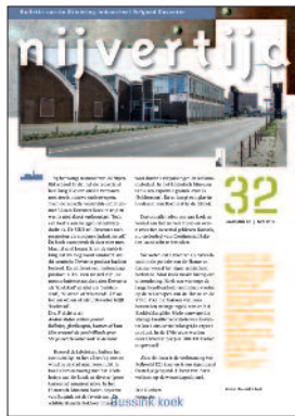
32 Bussink koek