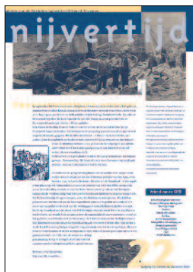
22 150 jaar Overijsselsch kanaal