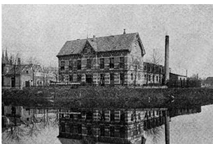
Wasserij G.W.S. Nierdt aan de Bergsingel

Terwijl vroeger de gewone burger de was zelf doet, besteden rijke mensen hun was uit: ze hebben een goed voorziene linnenkamer en laten een of twee keer per jaar (!) de was doen. Vaak nemen ze een abonnement. De prijs blijft zo constant en de wasserij