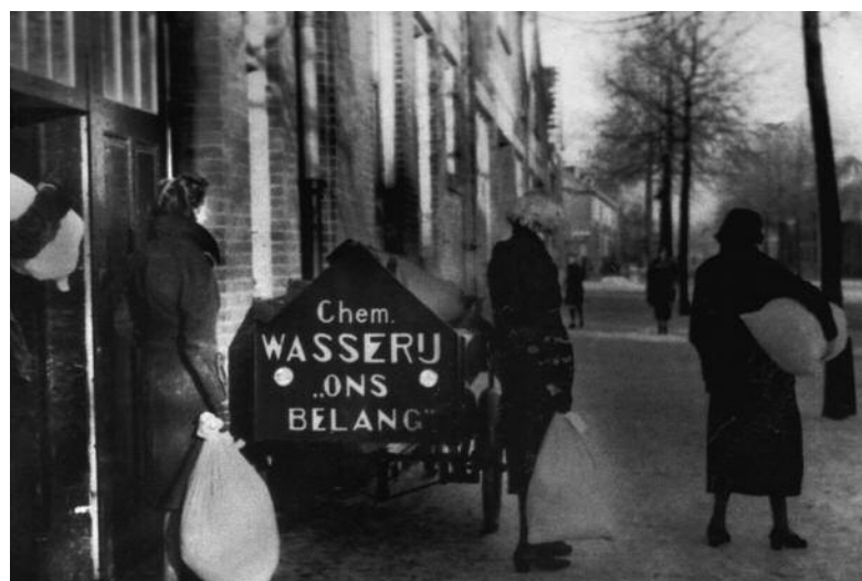
Wasserij Ons Belang aan de Boxbergerweg

DEVENTER STOOM-WASCH: BLEEK- EN STRUJKINRICHTING Buiten het Pothoofd DEVENTER. TELEFOON N o 336. VRAAGT TARIEVEN.