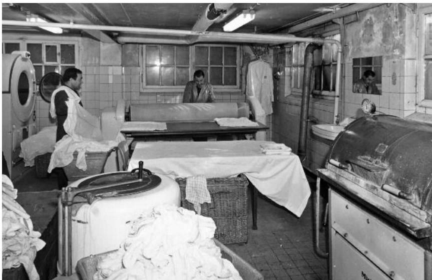
De wasserij van T&D in hotel de Leeuwenbrug

machine ter beschikking. In de jaren zestig komen in de stad verschillende 'wasserettes', een onderneming waar de klant zonder wasmachine tegen betaling er een kan gebruiken.