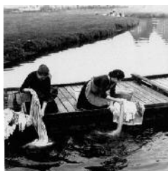
1941. Maandag wasdag

De machinale ontwikkeling is dus rond de Tweede Wereldoorlog vrijwel voltooid; in de jaren vijftig komt voor particulieren een compacte en automatisch werkende was-