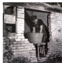
1946. Wassen in een teil