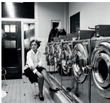
Wasserij de Ooievaar, Weseperstraat