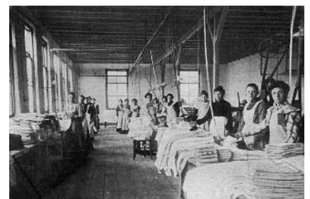
De strijkzaal van Nierdt