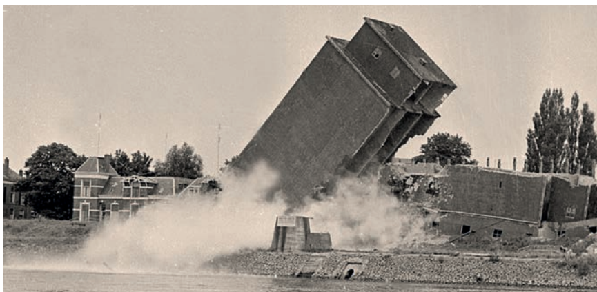
Op 28 juli 1973 werd de graansilo aan het Pothoofd opegeblazen met 15 kg springstof.

Zij leveren hun lading bij de klanten aan huis af. Eind jaren dertig koopt het bedrijf een vrachtauto met aanhanger om de klanten thuis te bedienen. De vijftig meter hoge graansilo bij het water komt in 1939 gereed. In 1945 krijgen de panden aan de Melksterstraat/Polstraat voltreffers bij de luchtaanvallen op de IJsselbrug. Ze worden verwoest. Alleen op Polstraat 54 is nog een fraaie pakhuisgevel te zien uit 1652.