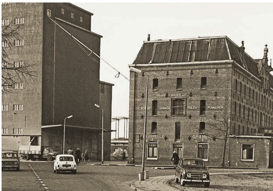
Silo met het pakhuis aan het Pothoofd

en in 1979 gaat de oude grutterijwinkel dicht. De vijf panden die dan deel uitmaken van het bedrijf komen te koop. Een plaquette op het pand vermeldt dat in 1982 het hoge pakhuis geheel is gerenoveerd. Vanaf ongeveer 1916 handelt Gerrit in alles wat hij zijn molenaars- en bakkersklanten en landbouwcoöperaties kan verkopen, zoals graan, meel en veekoeken, al of niet geïmporteerd.