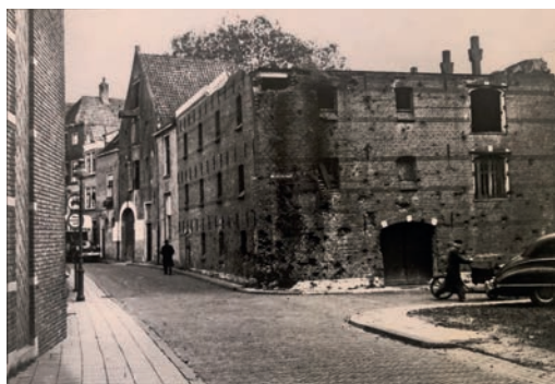
Verwoeste pakhuis hoek Polstraat/Melksterstraat