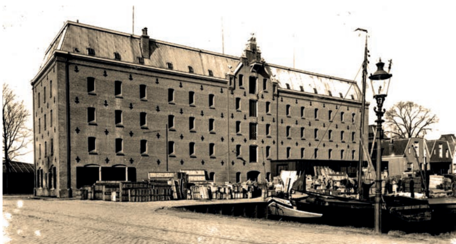
Achterkant van het pakhuis aan de Buitengracht