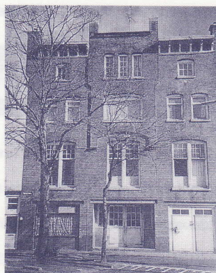
Voormalige sigarenfabriek van o.a. de fa. 'Hooier' aan de Tabakswal

sigaar) moet vrij van stukjes blad-steel zijn. Geen enkele sigarenroker vindt het prettig een stukje steel in zijn rookwaar te vinden. Verder sorteren ze de dekbladen. De Deventer sigarenmakers beseffen echter dat hun beroep gaat uitsterven. Het roken van 'die bruine stokken' neemt meer en meer af. De sigaret (niet meer dan een bundeltje stoffige draadjes) is sterk in opkomst. Jonge mensen willen geen sigaren leren maken. Die roken sigaretten.