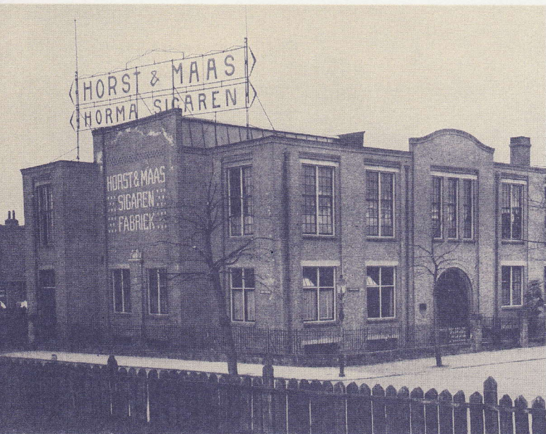
De voormalige Horst & Maas' fabriek aan de Reviusstraat