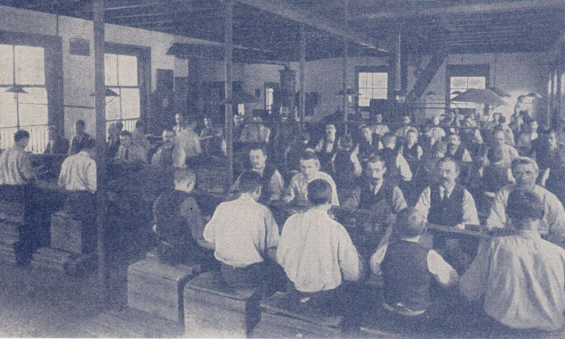
Werkzaal bij de fa. Hulscher. Foto ca. 1900

Intussen vormt Fetlaar een groep collega's om zich heen om een plaatselijke afdeling van De Nederlandschen Sigarenmakers- en Tabakbewerkers- bond op te richten. Dat gebeurt op 12 januari 1895. Dit alles zeer tegen de zin van de werkgevers. In Nederland breken hier en daar