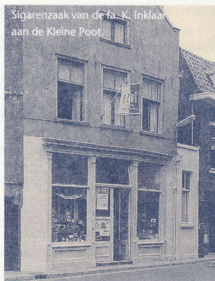
Sigarenzaak van de fa. K. Inklaar aan de Kleine Poort.